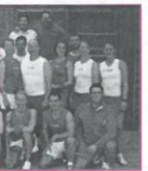
Iron System Team

DFAV-Mitglieder können LVE's zur Lizenzverlängerung erlangen und erhalten 5 Euro/Tag Ermäßigung